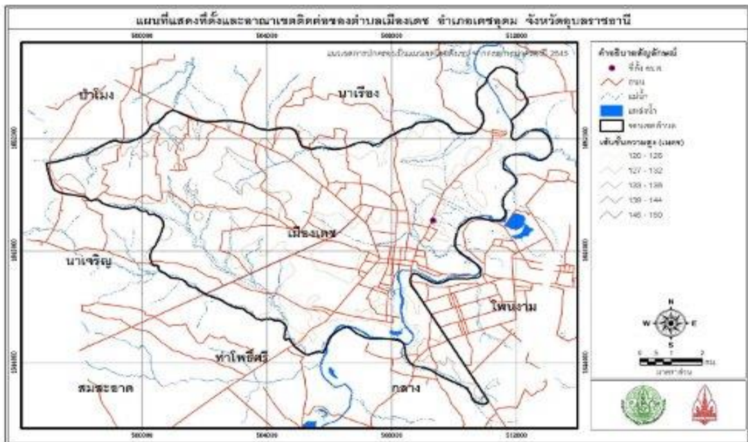
รูปที่ ๒-1 ที่ตั้งและอาณาเขตติดต่อของตำบล